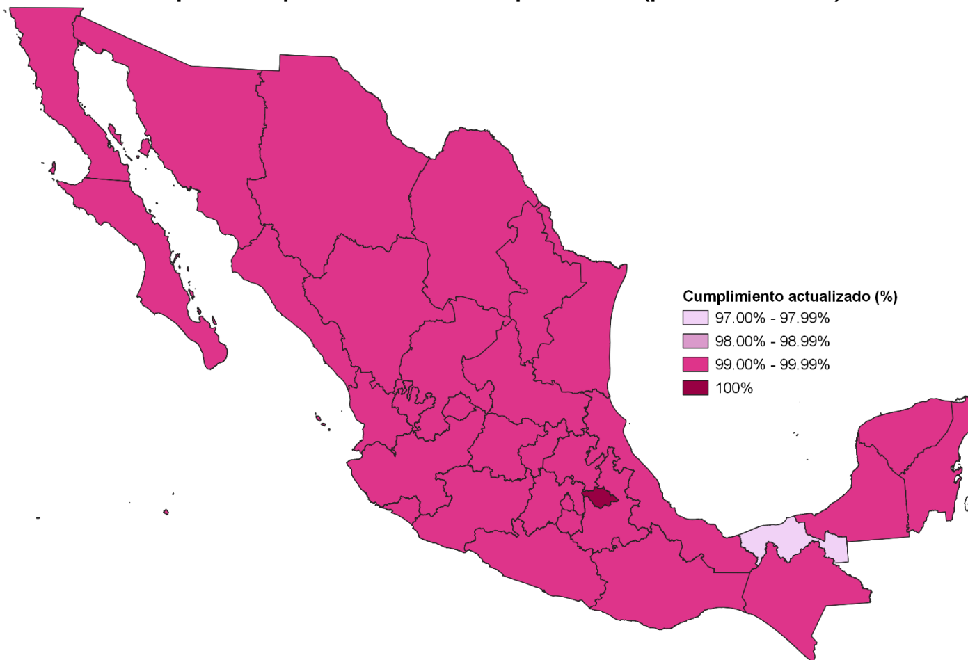
Mapa 1. Cumplimiento actualizado por entidad (proceso electoral)