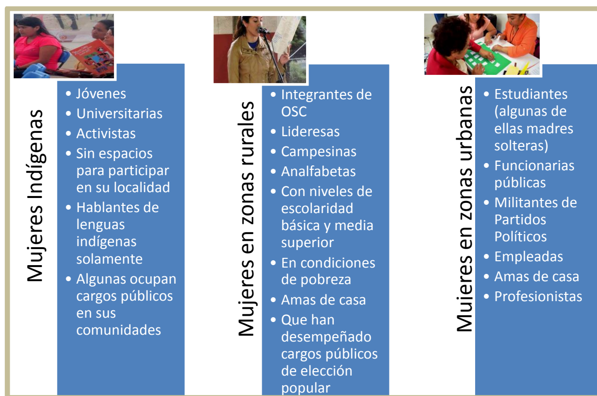
Cuadro 1. Perfiles de participantes

Todas ellas compartiendo los mismos obstáculos para la participación, con un propósito común: acceder a espacios públicos de toma de decisiones en donde su voz y su voto cuente igual al de los hombres y tengan las mismas oportunidades para participar. Estas mujeres aprendieron durante el desarrollo de sus proyectos, que es mejor trabajar en equipo y generar alianzas.