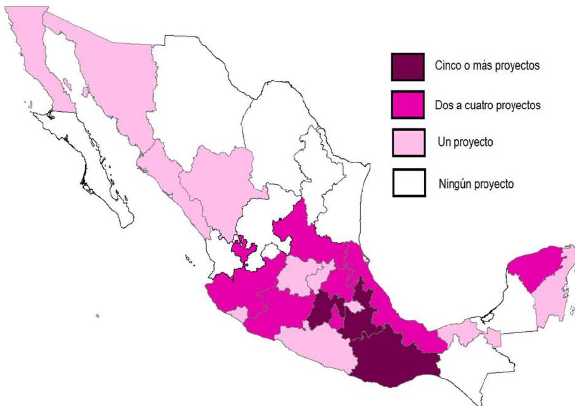
Figura. 9 Distribución Geográfica

Sistematización de informes finales del Programa de las Naciones Unidas para el Desarrollo (PNUD)