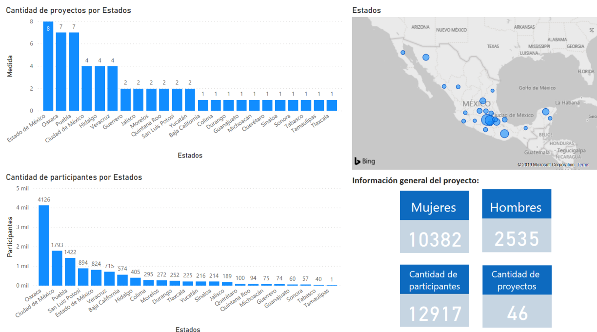
Figura 12. Mapa interactivo de la sistematización de informes finales del Programa de las Naciones Unidas para el Desarrollo (PNUD)