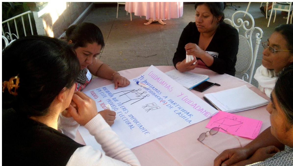
Fotografía 1. Mujeres en sesión del MEPE

Mujeres participantes del taller del MEPE del Colectivo R.E.D. Respeto, Equidad y Diversidad Social, A.C.