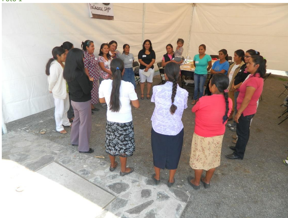
Mujeres participantes del taller de Enlacecc IAP

Otro factor que ayudó en esta etapa son los antecedentes de participación ciudadana y lucha social de la población participante. Señalado por el 28% de las organizaciones. Mientras que el 14% de las organizaciones mencionó la capacitación previa de las y los participantes en temas de equidad de género y derechos de las mujeres. En la misma proporción se señaló el fortalecimiento de sinergias locales, las habilidades del grupo, los liderazgos existentes, y la posibilidad de replicar los procesos, dado que las mujeres que van aprendiendo sobre sus derechos, lo saben socializar con otras mujeres. Explícitamente el 9% de las organizaciones indicó que las mujeres mostraron interés por iniciarse como