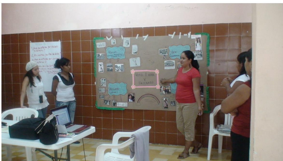
Mujeres participantes del taller que impartió la OSC MAIZ.

Entre los principales resultados obtenidos a través de sus proyectos, con diversos grados de desarrollo, las OSC reportan en sus informes finales el involucramiento principalmente de mujeres y jóvenes en las siguientes acciones de participación: