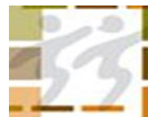
Cuadro 2. Proyectos del Modelo de Educación para la Participación Democrática